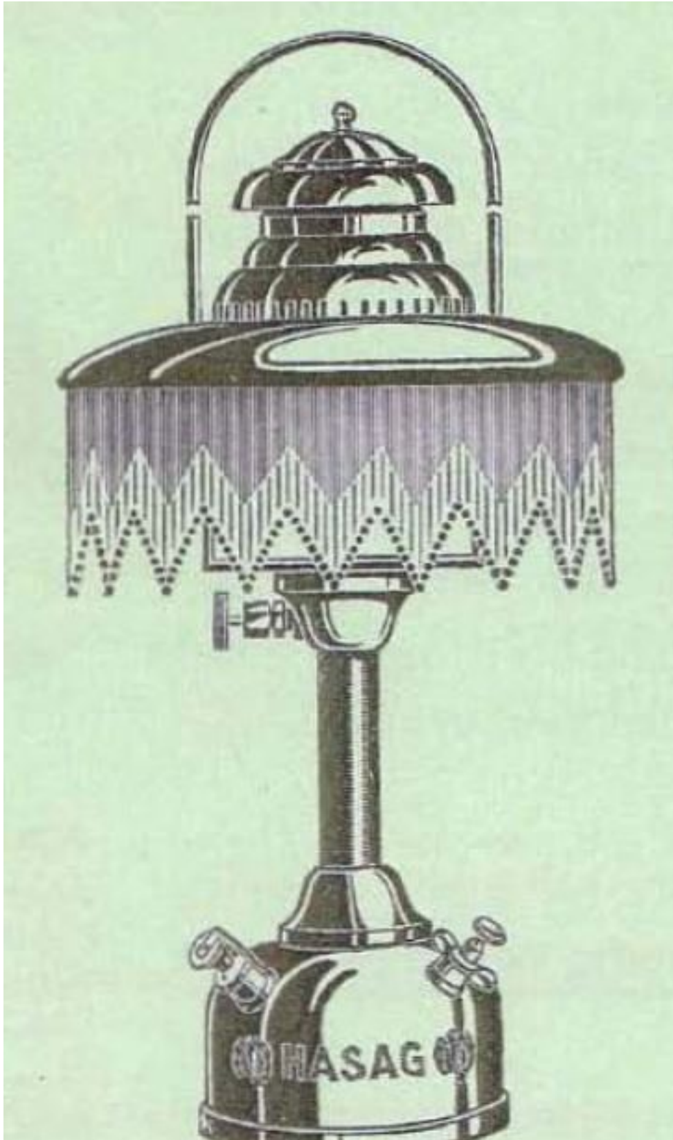
La Hasag 55 telle que présentée sur un catalogue de 1938.