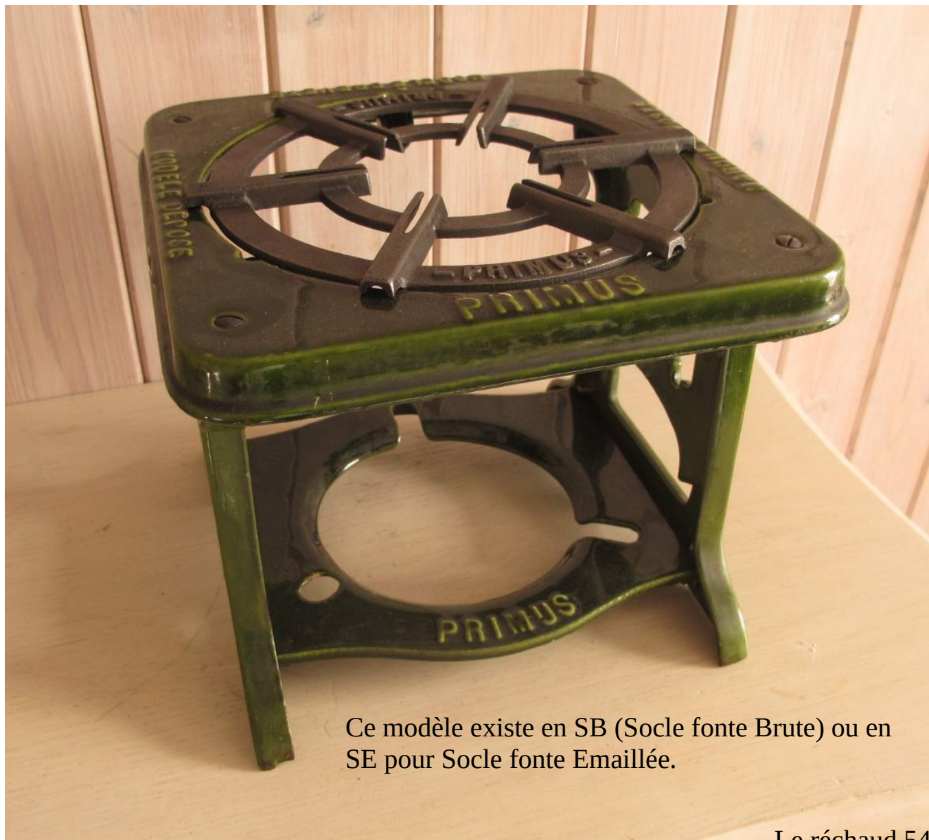
Ce modèle existe en SB (Socle fonte Brute) ou en SE pour Socle fonte Emaillée.