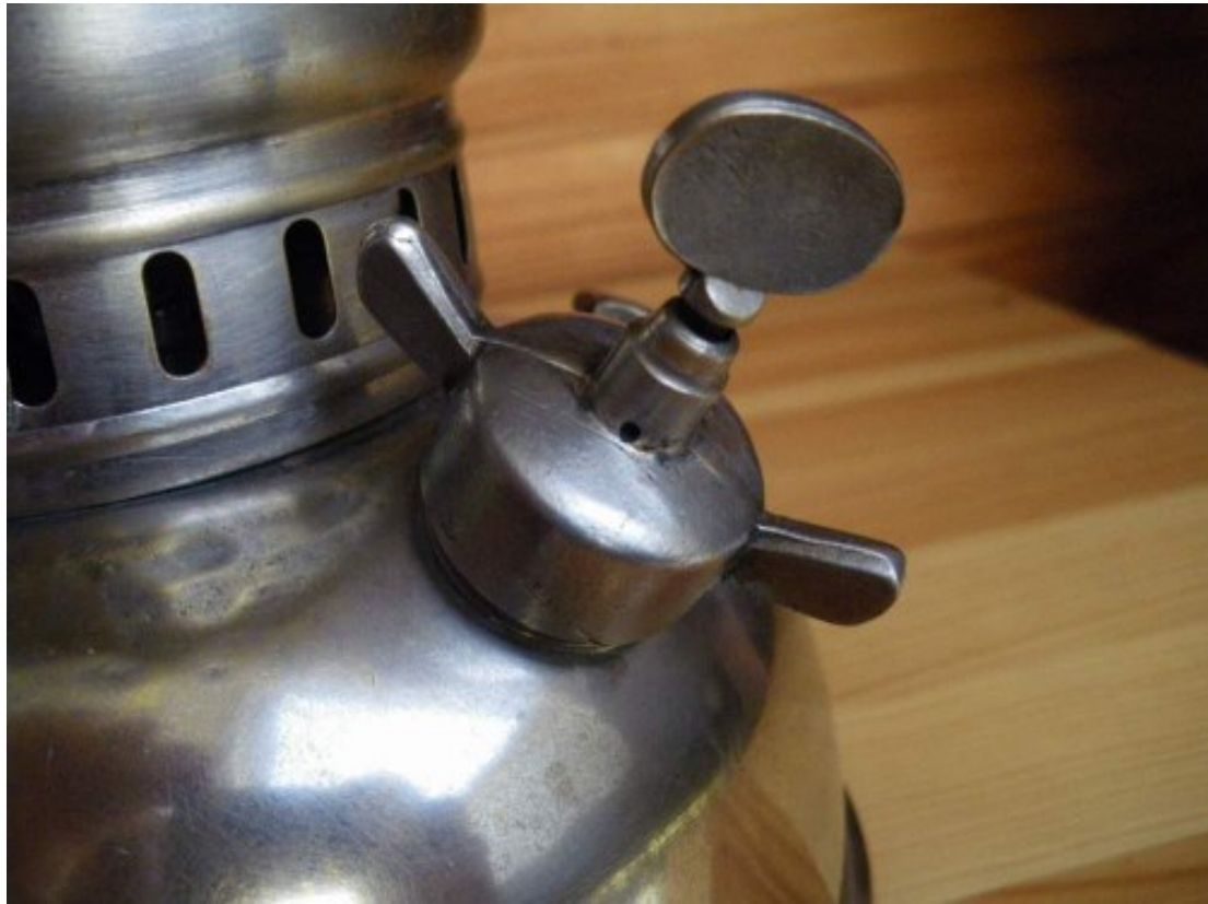
Le bouchon de remplissage à ailettes et la manette des gaz en Pertinax .