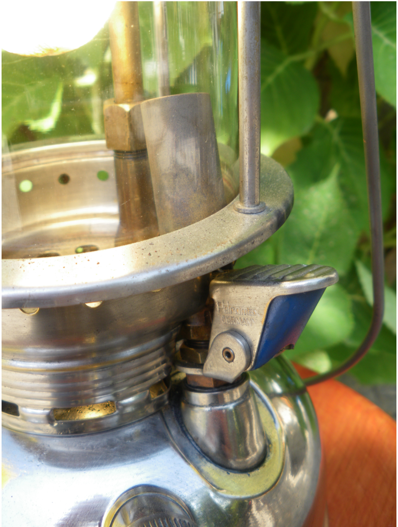
Le préchauffeur type 1964 et plus .....