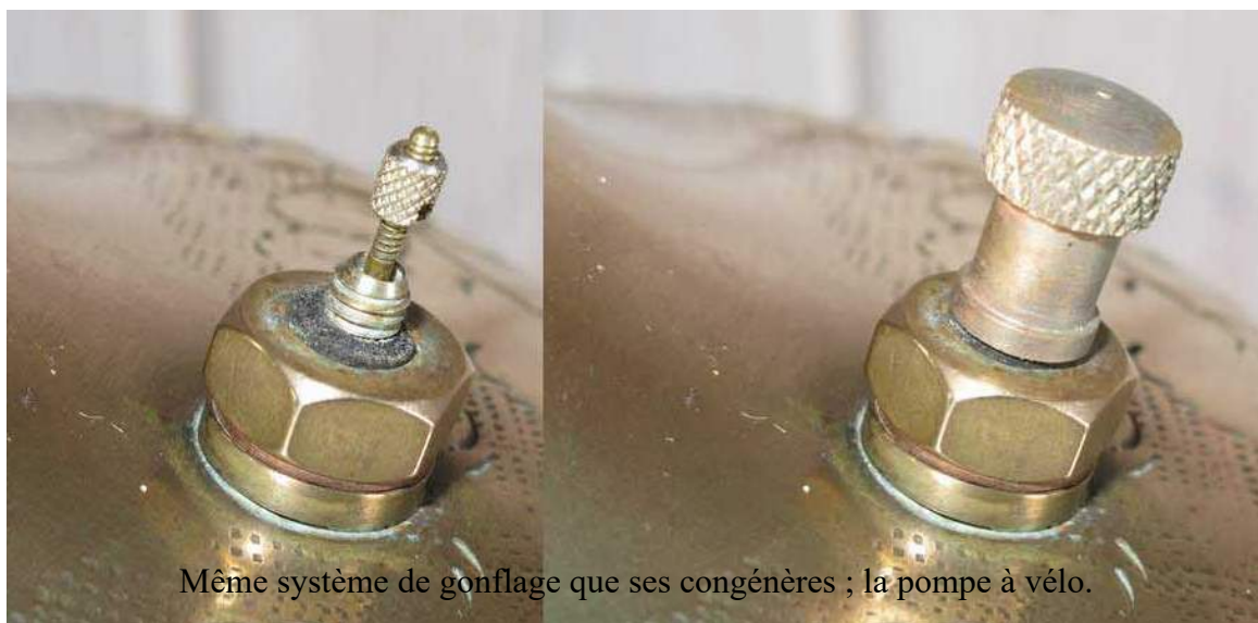
Même système de gonflage que ses congénères ; la pompe à vélo.