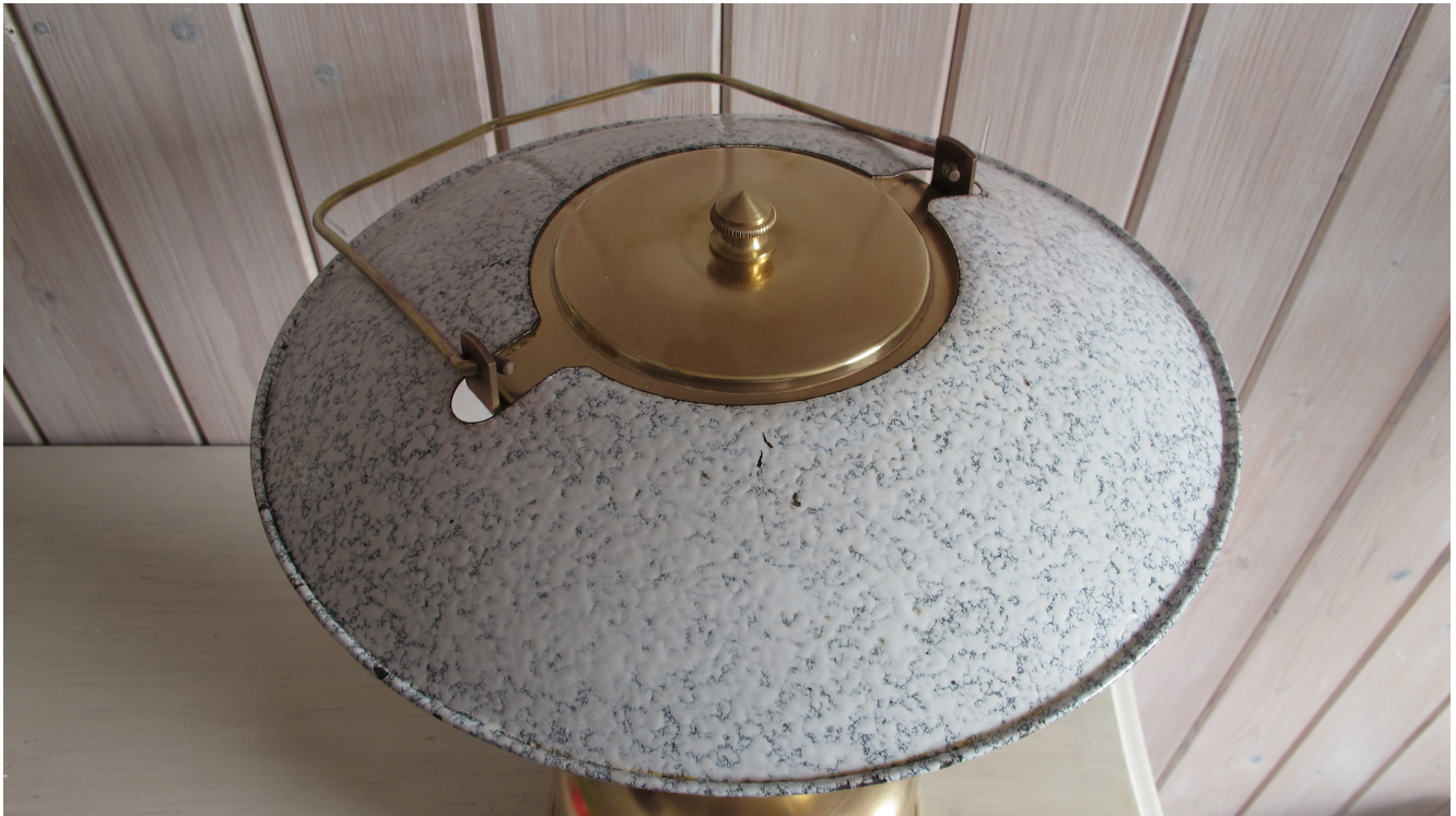
L 'abat-jour émaillé est juste posé sur le dessus de la lampe. La molette des gaz et le bouchon sont signés.