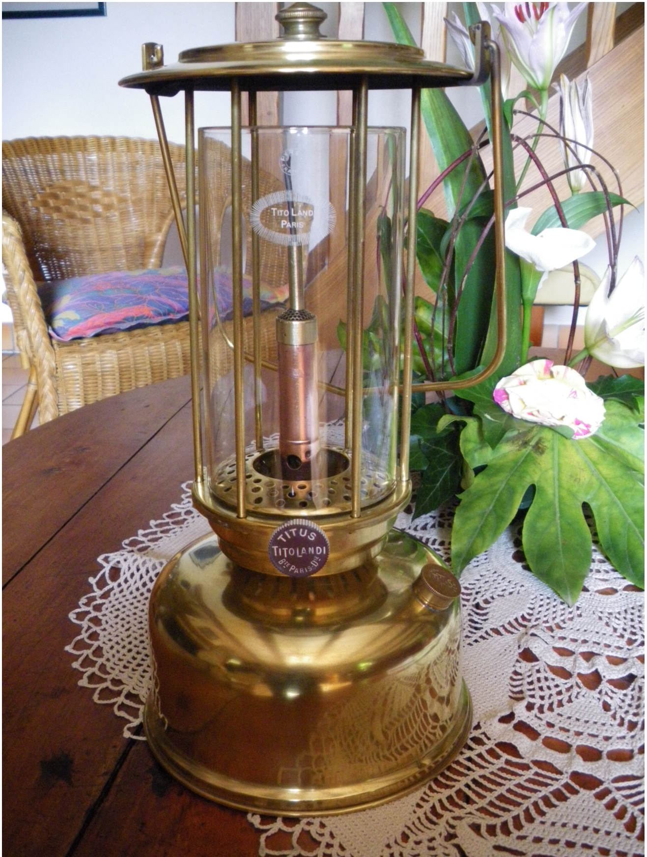
Cette lampe, ici une version à essence, est équipée d'un beau verre de 9 cm de diamètre estampillé au nom du fabricant.