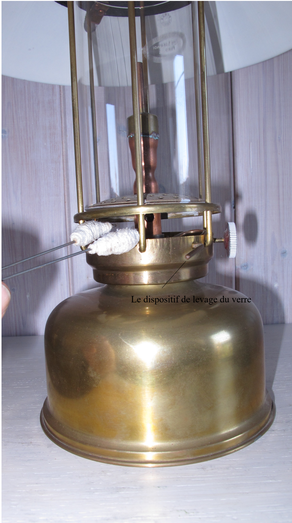
Le dispositif de levage du verre

Ce modèle, sans doute des plus tardifs, est équipé d'un dispositif qui permet de soulever le support du verre afin de glisser la taupette d'allumage sous le brûleur pour le préchauffage. Sur les plus anciens, il fallait lever le verre à la main.