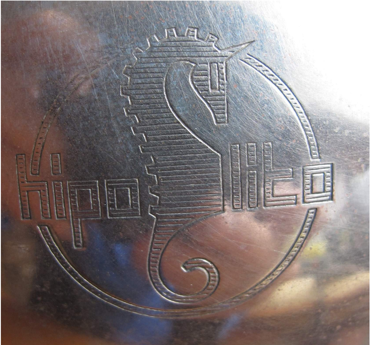
On ne peut se tromper sur l'origine de la machine