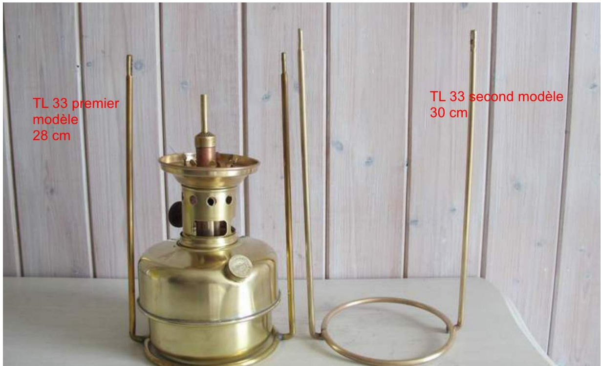
TL 33 premier modèle 28 cm