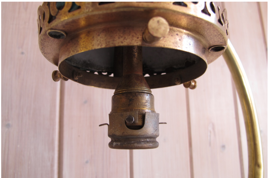
L'éjecteur doit recevoir une petite douille qui sera clipsée sur les deux tétons. Cela permettra de ficeler le manchon.