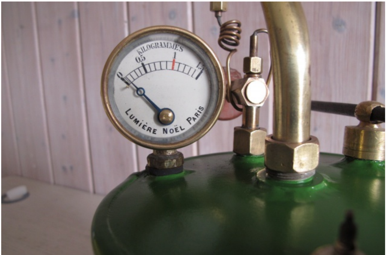
Un manomètre pour myopes ;-)